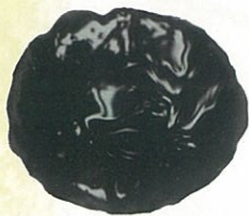
Barwniki w paście MAGIK COLOR